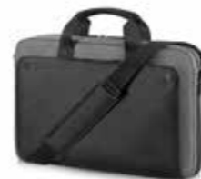
HP Executive 15,6" Black Top Load Ref. P6N18AA