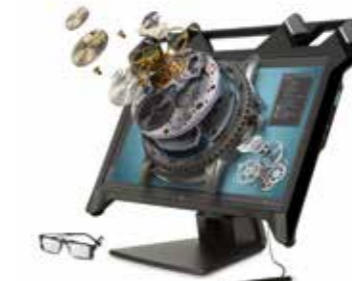
HP Zvr Display 23,6", 16:9, FHD Ref. K5H59A4