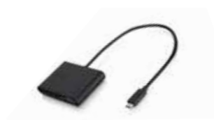
HP USB Type C™ Adapter Ref. Y5S33AA