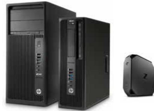
HP Z Desktop Workstation