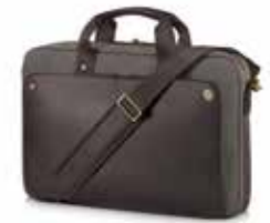
HP Executive Top Load 15.6" Braun Ref. P6N19AA