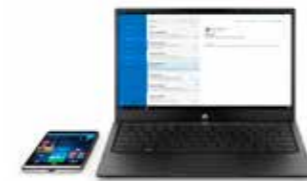
HP Elite x3 Lap Dock Ref. Y1M47EA