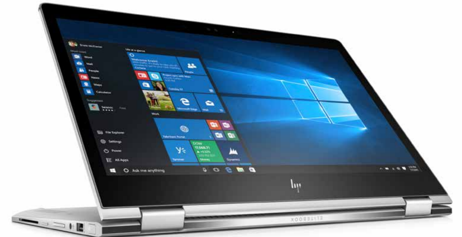
HP EliteBook x360 1030 G2

Innovative Premium-Funktionen im edlen Design: Mit unserem beeindruckenden Computing-Portfolio bieten wir dem Anwender ein erstklassiges Produkterlebnis. Dank 360°-Funktionalität und individuellen Anwendungsmodi verbunden mit neusten Sicherheitsfunktionen und bemerkenswerter Audioqualität bieten wir kompromisslose Leistung für höchste Ansprüche.