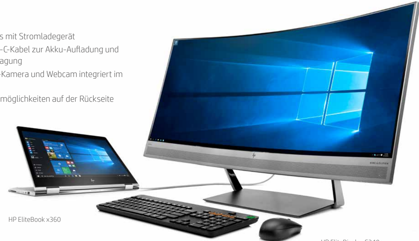
HP EliteBook x360