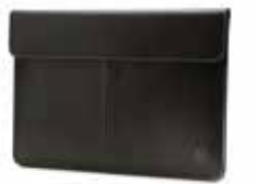
HP Executive Leather Sleeve Ref. M5B12AA