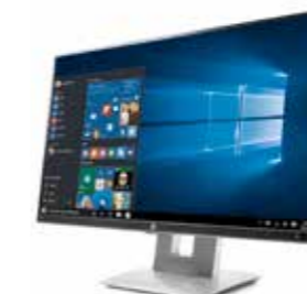
HP EliteDisplay E230t 23", 16:9, FHD Ref. W2Z50AA