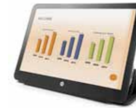
HP EliteDisplay S140u 14", 16:9, HD+ Ref. G8R65AA

Spezialanforderungen bedingen Speziallösungen – und solche haben wir bereits vorbereitet: Ein 14" Monitor für unterwegs, ein 23" Monitor mit Touch-Funktion, ein kommerzielles 3D Display, ein 30" Display im 16:10 Format und ein gestandenes 34" Curved Display. Wählen Sie Ihr Modell – ganz nach Ihren Wünschen und individuellen Bedürfnissen ausgerichtet.