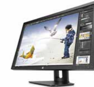
HP Z30i Display 30", 16:10, WQXGA Ref. D7P94A4