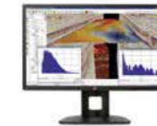
HP Z27s Display Ref. J3G07A4