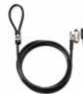
HP Keyed Cable Lock Ref. T1A62AA