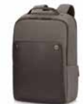
HP Executive Brown Backpack Ref. P6N22AA