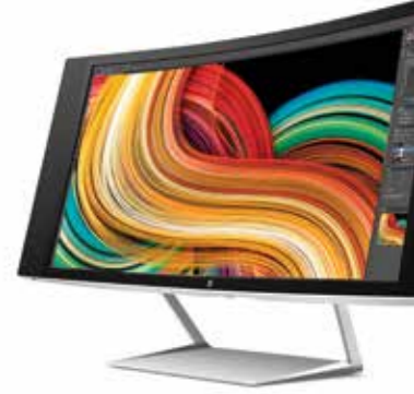
HP Z34c 34", 21:9, WQHD Ref. K1U77A4