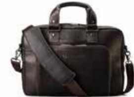
HP Executive Top Load Leather Case Ref. T9H72AA