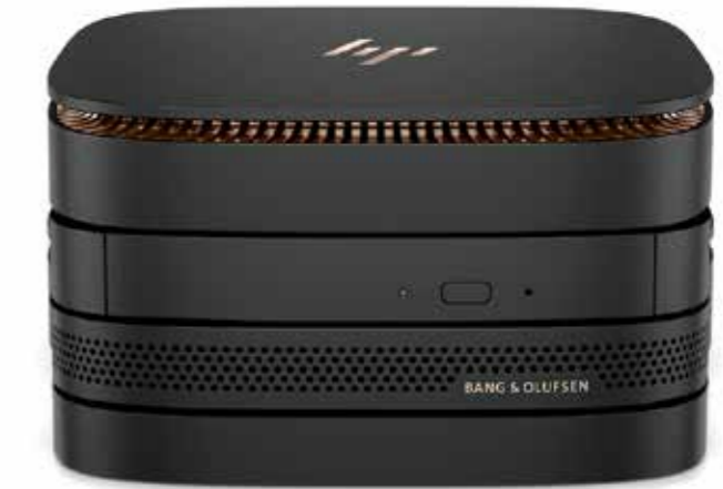
HP Elite Slice