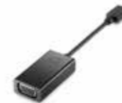
HP USB-C to VGA Adapter Ref. N9K76AA