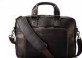
HP Executive Top Load Leather Case Ref. T9H72AA