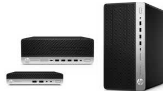
HP ProDesk Serie